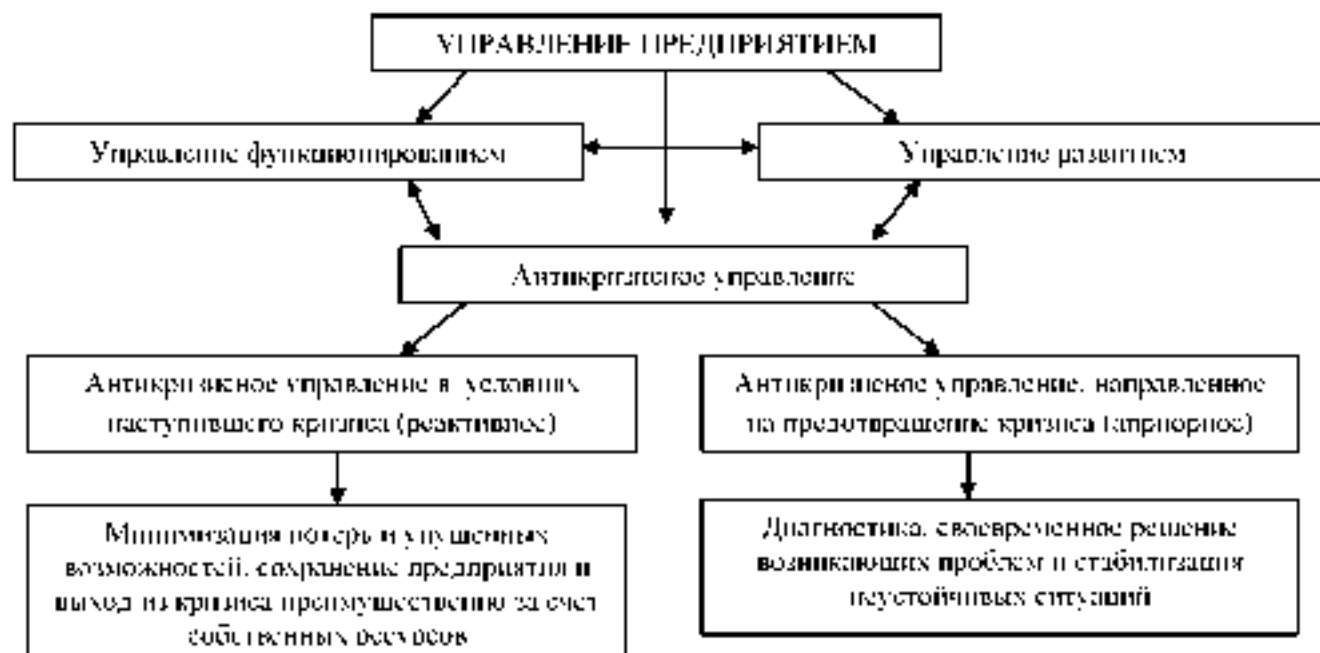
Рис. 2. Место антикризисного управления в системе управления предприятием

возникают вследствие несбалансированности между функционированием и развитием, поэтому антикризисное управление рассматривается в качестве одной из составляющих системы управления предприятием в целом, которая способна примирить существующие, но порой противоположные тенденции (рис. 2). Таким образом комплексный механизм дифференцированного антикризисного управления состоит из двух составляющих: