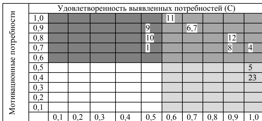
Рис. 3. Мотивационный потенциал работника

Чтобы понять, на какие мотивационные факторы необходимо повлиять, значения из табл. 2 переносятся на диаграмму, которая разделена на четыре квадрата (рис. 3).