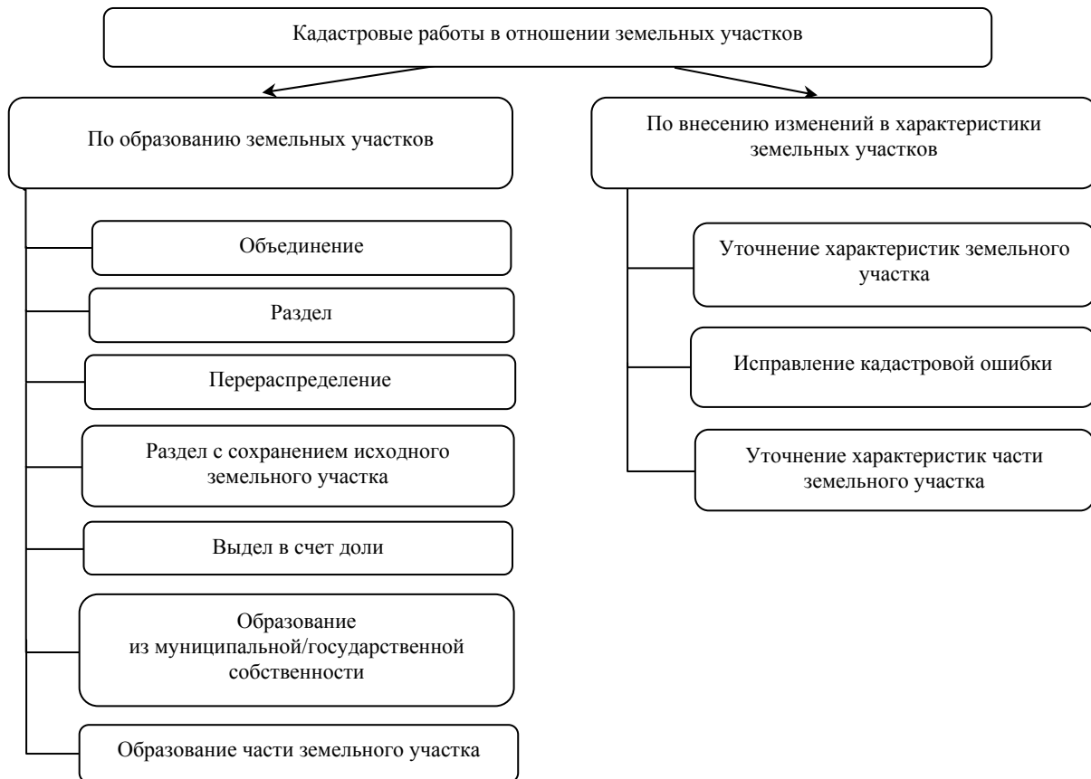
Рис.1. Виды кадастровых работ, в результате которых формируется межевой план

Методы исследования. В рамках данной работы авторами были использованы такие методы научного исследования, как анализ нормативно-правовой базы, изучение программных комплексов, аналитический метод.