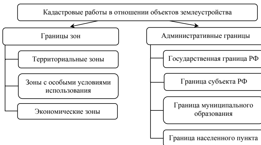
Рис.3. Виды кадастровых работ, в результате которых формируется карта (план) объектов землеустройства

Документом, отражающим основные данные объектов землеустройства, необходимые для внесения сведений в государственный кадастр недвижимости, является карта (план) объектов землеустройства. Особенности формирования данного документа также зависят от вида объекта, для которого он составляется (рис.3).