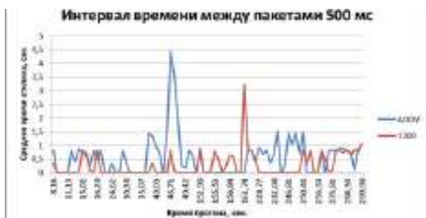
Рис. 5. Результаты измерения задержки при среднем времени между пакетам 500 мс.