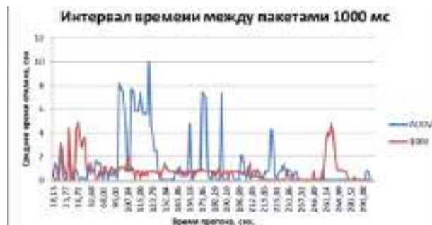
Рис. 3. Результаты измерения задержки при среднем времени между пакетами 1 сек.

Первый эксперимент был поставлен при интенсивности генерации пакетов 1/1000 мс с экспоненциальным распределением времени между пакетами. На рисунке 3 показаны графики времени отклика при заданных параметрах для протокола AODV и разработанного протокола маршрутизации на базе Painless mesh.