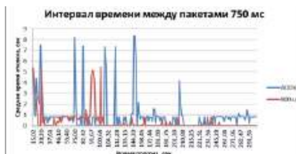
Рис. 4. Результаты измерения задержки при среднем времени между пакетами 750 мс.

Второй эксперимент был поставлен при интенсивности генерации пакетов 1/750 мс с экспоненциальным распределением времени между пакетами. На рисунке 4 показаны графики времени отклика при заданных параметрах для протокола AODV и разработанного протокола маршрутизации на базе Painless mesh.