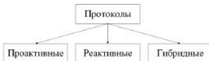
Рис. 3. Протоколы маршрутизации в самоорганизующихся сетях Fig. 3. The routing protocols in self-organizing networks

В тоже время уже существует множество протоколов маршрутизации используемых в самоорганизующихся сетях. Один из возможных вариантов классификации протоколов маршрутизации основан на принципах их работы (рисунок 3).