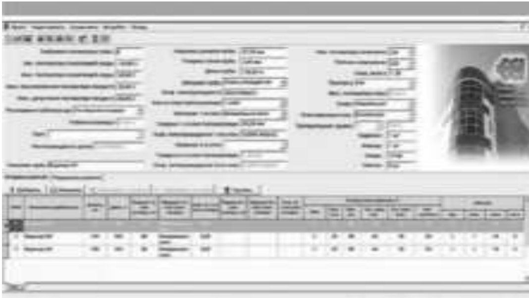
Рис. 4. Программа «Тепломаг» Лист внесения исходных данных и результатов расчета тепловых потерь.

Результаты перечисленных выше исследований явились научной основой серийного производства отечественных скин-систем. Они реализованы в виде программных средств и проектных решений, о которых будет рассказано в следующих публикациях.