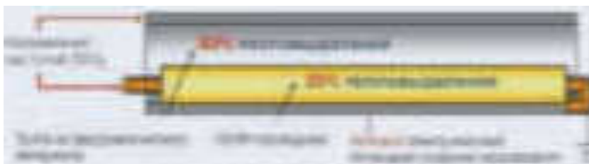
Рис. 1 Принципиальная схема индукционно-резистивного нагревателя

За счет тока, протекающего по кабелю, в жиле кабеля выделяется тепловая энергия согласно закона Джоуля- Ленца. В обратную сторону ток протекает по ферромагнитной трубке. Взаимодействие электромагнитных полей внутреннего и внешнего проводников порождает следующие эффекты.