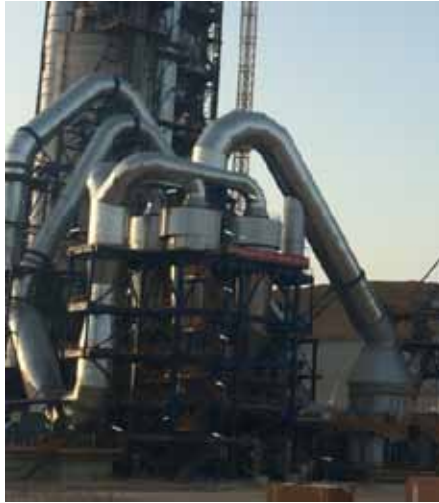
Рис. 3. Общий вид установок с модульными сырьевыми вертикальными валковыми мельницами