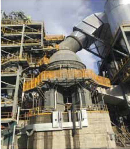
Рис. 2. Общий вид сырьевой модульной ВВМ, установленной на заводе в Северной Америке