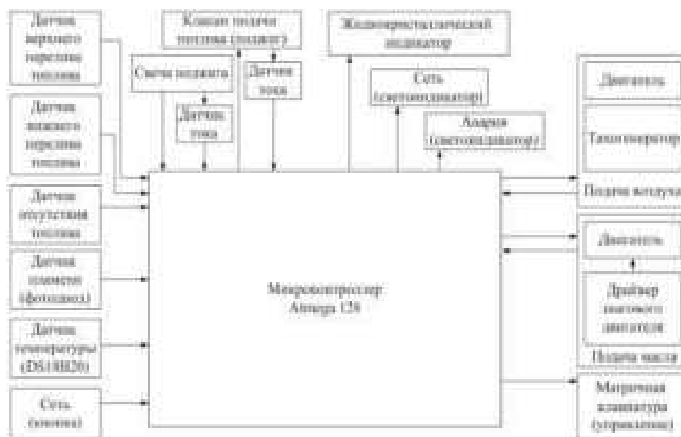
Рис. 1. Структурная схема разработанной системы управления

рается и по истечении нескольких минут разогревает камеру сгорания котла. Чтобы запитать свечу необходим источник напряжения 400 Вт, выходные параметры: по напряжению 20 В., по току 20 А. Для этого был разработан силовой источник питания, за его основу был взят импульсный полупериодный источник питания. После модернизации и проведенных экспериментов блок питания получился компактным и выдавал необходимую мощность. В качестве интерфейса управления был использован двухстрочный жидкокристаллический индикатор (ЖКИ) и матричная клавиатура. С помощью клавиатуры задается режим работы системы и все рабочие параметры, температуры воды, выводимые параметры на ЖКИ. Всей системой в целом управляет микроконтроллер корпорации Atmel, семейства AVR, модель ATmega128. Микроконтроллер управляет подачей воздуха и подачей масла, по записанному в память алгоритму, тем самым регулируя и поддерживая заданную температуру котла, следит за уровнем пламени в камере сгорания. Для системы управления и блока питания были спроектированы и изготовлены печатные платы. Под систему управления был изготовлен корпус. После подготовки котла к работе и проверки работоспособности системы управления этап разработки перешел в этап тестирования всей системы в целом.