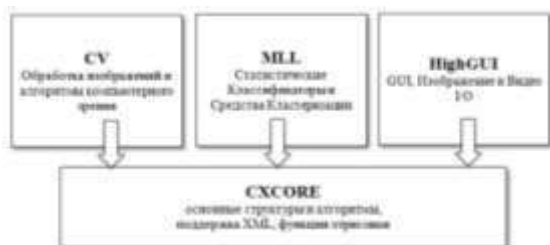
Рис. 2. Базовая структура OpenCV

Структура библиотеки представлена на рис. 2. На данном рисунке не представлен еще один — пятый компонент библиотеки, а именно CvAux (экспериментальные алгоритмы). CvAux содержит: 1D и 2D скрытая Марковская модель, техника статистического распознавания с использованием метода динамического программирования, Встроенная СММ, Распознавание жестов благодаря стерео зрению, Стереозрение, Deskriptor текстур, Поиск скелета (центральных линий) объектов сцены, видеонаблюдение и т.д.