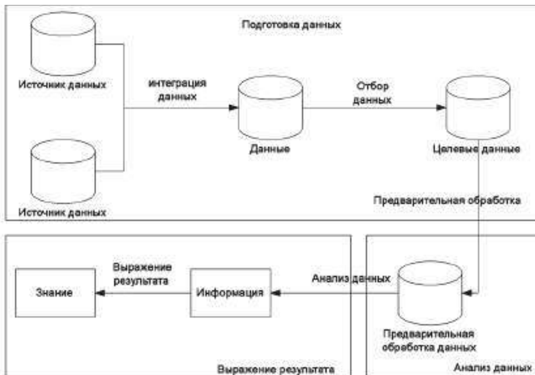
Рис. 1. Общий процесс анализа данных