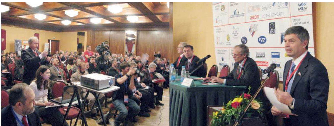
Первый Российский международный конгресс по ИТС (7–8 апреля 2009 г., Москва)

ISTEA впервые учредил разработанную Минтрансом США Федеральную программу. В 1996 году началась разработка программы стандартов ИТС по списку критических интерфейсов. Определена ведущая роль Минтранса США и созданы структуры федерального уровня для продвижения интегрированной ИТС.