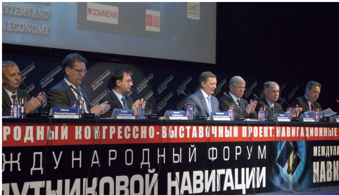
III Международный форум по спутниковой навигации (12–13 мая 2009 г., Москва)

дящих в систему обеспечения общественной безопасности. При этом эксплуатирующиеся в стране системы АСУДД в большинстве случаев относятся к системам первого поколения, не позволяющим доступными им простейшими средствами регулирования добиться улучшения ситуации.