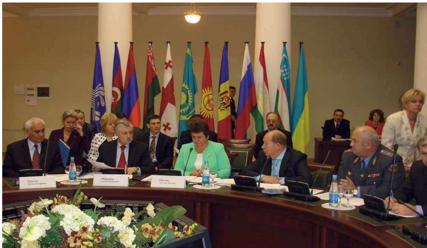
Международный конгресс «Безопасность на дорогах ради безопасности жизни» (17 сентября 2008 г., Санкт-Петербург)