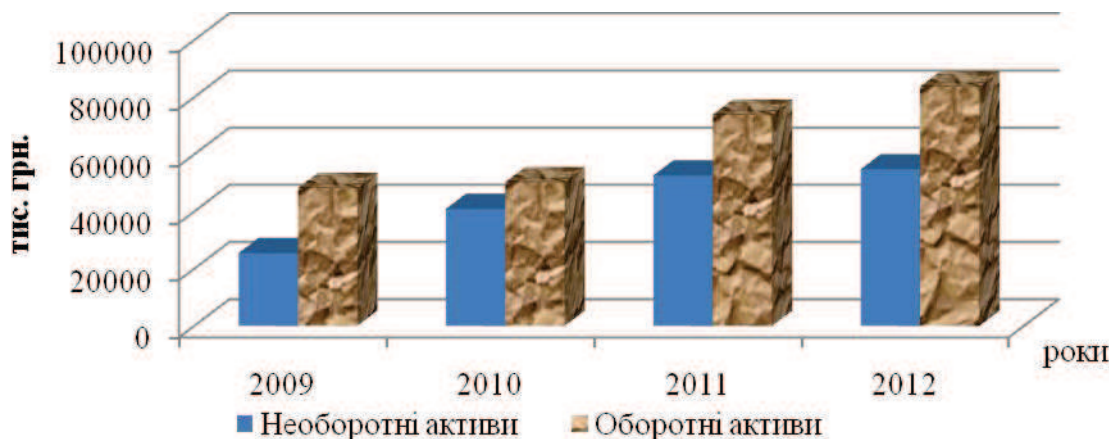
Рис. 1. Динаміка оборотних і необоротних активів сільськогосподарських підприємств Якимівського району, 2009-2012 рр. (на кінець року)

Оцінка майнового стану в першу чергу передбачає аналіз динаміки загальної суми коштів, що має у своєму розпорядженні підприємство (актив) та джерел їх утворення (пасив), а також їх структури, що впливатиме на загальні показники, що характеризують фінансовий стан підприємства. Так, сума активів сільськогосподарських підприємств Якимівського району Запорізької області збільшилася з 73,7 млн. грн. у 2009 році до 138,5 млн. грн. у 2012 році, тобто у 1,9 рази. При цьому у структурі активів більшу частину займають оборотні активи (55-65%) (рис. 1). Відомо, що чим більша доля оборотних активів, тим вищим є ступінь мобільності активів загалом.