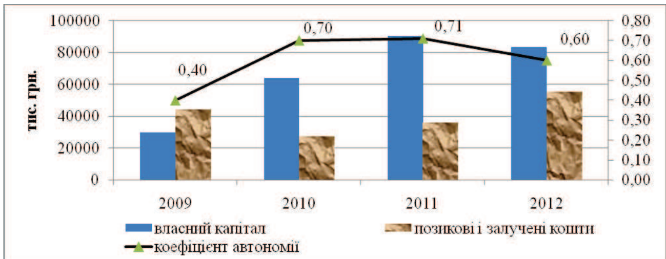
Рис. 3. Динаміка коефіцієнта автономії сільськогосподарських підприємств Якимівського району, 2009-2012 рр. (на кінець року)