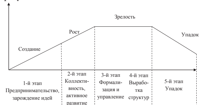
Рис. 2. Этапы жизненного цикла предприятия

Этапы, которые проходит предприятие в процессе жизненного цикла своего развития, приведены на рисунке 2.