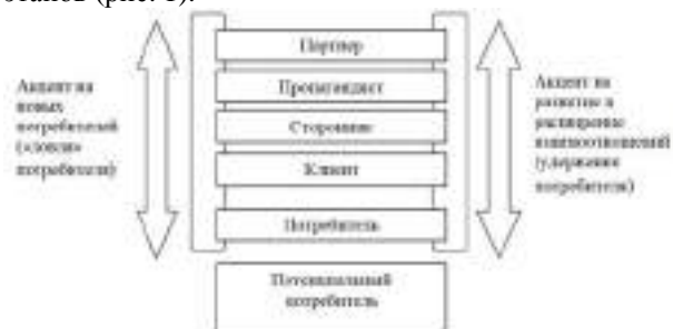
Рис. 1 – Лестница взаимоотношений с потребителями [4]

Ведущими западными менеджерами введено понятие «лестницы взаимоотношений с потребителем», в соответствии с которой процесс развития долговременных отношений состоит из нескольких этапов (рис. 1).