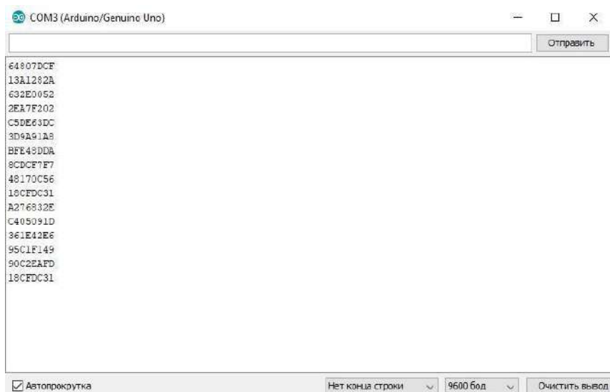
Рисунок 3 – Значения кнопок с ИК пульта

При загрузке скетча используется Загрузчик (Bootloader) Arduino, небольшая программа, загружаемая в микроконтроллер на плате. Она позволяет загружать программный код без использования дополнительных аппаратных средств. Загрузчик (Bootloader) активен в течении нескольких секунд при перезагрузке платформы и при загрузке любого из скетчей в микроконтроллер [3].