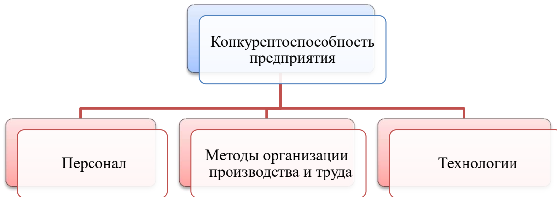
Рис. 1. Конкурентоспособность предприятия

Конкурентоспособность персонала является важным фактором не только для организации, но и для работника, так как условия современной экономики создают возможности для развития профессиональной личности. С другой стороны, современный рынок труда, достаточно подвижен, что вносит в жизнь человека достаточную степень неопределённости. Работник всегда должен быть готов к цивилизованным формам и методам конкурентной борьбы. К сожалению, на практике оказывается, что не все работники к этому готовы.