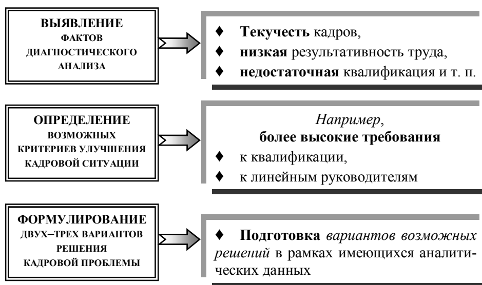
Рис. 1. Анализ кадровой информации

а) Оценку располагаемых ресурсов и их соотношение, выявление ограничений. Анализ кадровой информации (см. рис. 1).