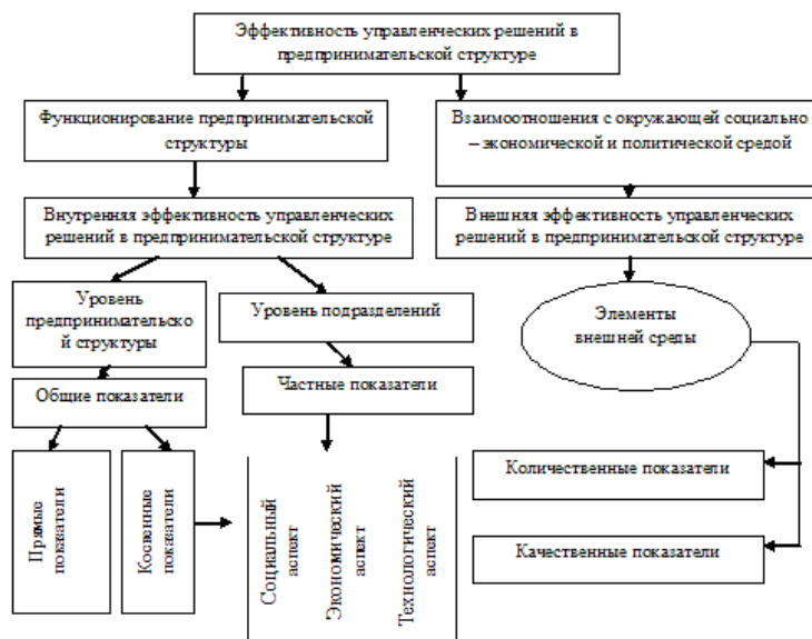
Рис. 3. Комплексная оценка эффективности управленческих решений в предпринимательских структурах

Задача определения эффективности управленческих решений включает обоснование выбора основополагающего критерия эффективности в каждом конкретном случае при принятии решения и выбор методики расчета по этому критерию. На рис. 3 дана комплексная оценка эффективности управленческих решений в предпринимательской структуре. Её обязательным условием является изучение каждого отдельно взятого показателя, выражающего локальную характеристику эффективности, в сопоставлении с другими показателями системы.