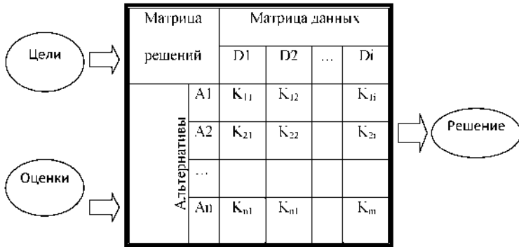
Рис. 4. Модель принятия решения

Результатом диагностических процедур является комплексный показатель (балл), который назначен каждому претенденту. Для получения комплексного показателя была произведена аппроксимация всех данных, полученных опытным путем. Если претендентов на вакантное место несколько, то наиболее правильным решением будет принять человека с наивысшим баллом. Так же тестируемому присваивается результат в виде градации (абсолютно годен, годен, условно годен, не годен) [11]. Для снижения риска принятия неправильных решений менеджеру предлагается инструментарий в виде модели принятия решения (рис. 4).