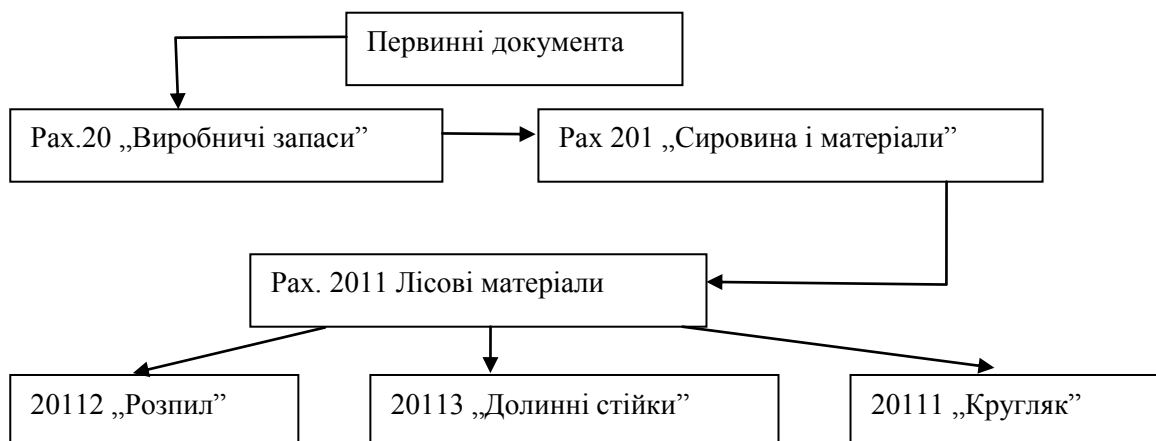
Рисунок 2 Організація аналітичного обліку виробничих запасів

Приклад, який ілюструє взаємозв'язок синтетичних рахунків, субрахунків та аналітичних рахунків наведено на рис.2