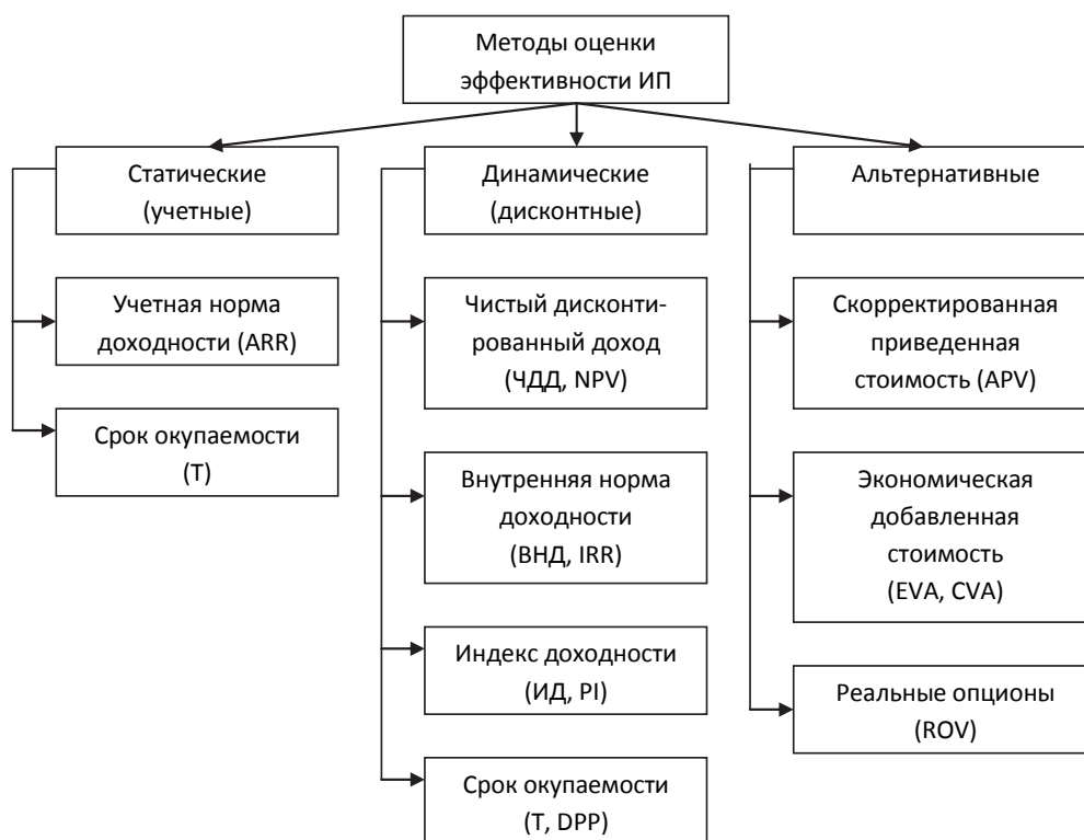
Рис. 2. Классификация методов оценки экономической эффективности инвестиционных проектов [3]

имуществам статических методов относятся простота и наглядность расчетов.