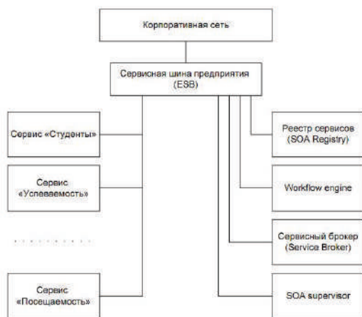
Рисунок 2 – Основные компоненты SOA

Каждый бизнес имеет свой workflow, являющимся случайным в каждом конкретном случае или формально описанным, сложившийся как бы само собой или возникший в результате тщательного анализа и автоматизации. Workflow engine - это программный продукт, позволяющий соединить весь бизнес процесс в корпоративной информационной системе от начала до его завершения, система для воспроизведения потока работ по имеющейся модели. Ядро веб-портала, обеспечивающие обработку данных и является workflow