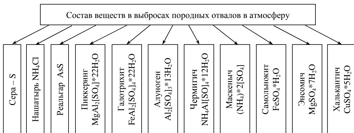
Рисунок 2 – Состав веществ, которые содержатся в выбросах породных отвалов

Уравнение (1) характеризует зависимость изменения площади боковой поверхности от высоты отвала.