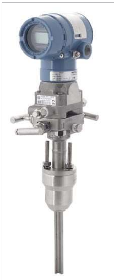
Рис. 1. Метран-150RFA тип монтажа Pak-Lok

базе ОНТ Annubar (рис. 4). Очевидно, что Метран-150RFA – это действительно экономичное решение для измерений расхода, особенно на трубопроводах больших диаметров. А сколько стоит такой расходомер? Применение датчика давления Метран-150 в составе расходомера позволяет поставить Метран-150RFA на одну ценовую ступень с отечественными измерительными комплексами на базе стандартных диафрагм. ►