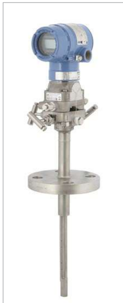
Рис. 2. Метран-150RFA фланцевый тип монтажа