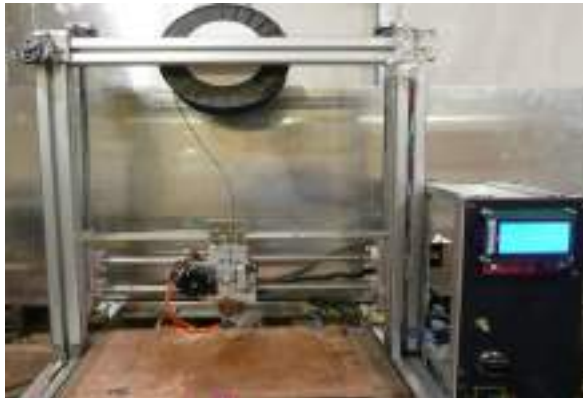
Рис.2. 3D-принтер, созданный студентами НСО ЕГУ им. И.А. Бунина

Внешний вид устройства объемной печати, использующего FDM-технологии, представлен на рис. 2.