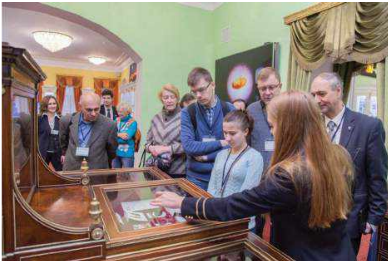
Рис. 7. Участники симпозиума НиН-2016 на экскурсии в Горном музее

марна, цитированных в статье [1], в докладе А. Г. Сыркова сделаны важные выводы.