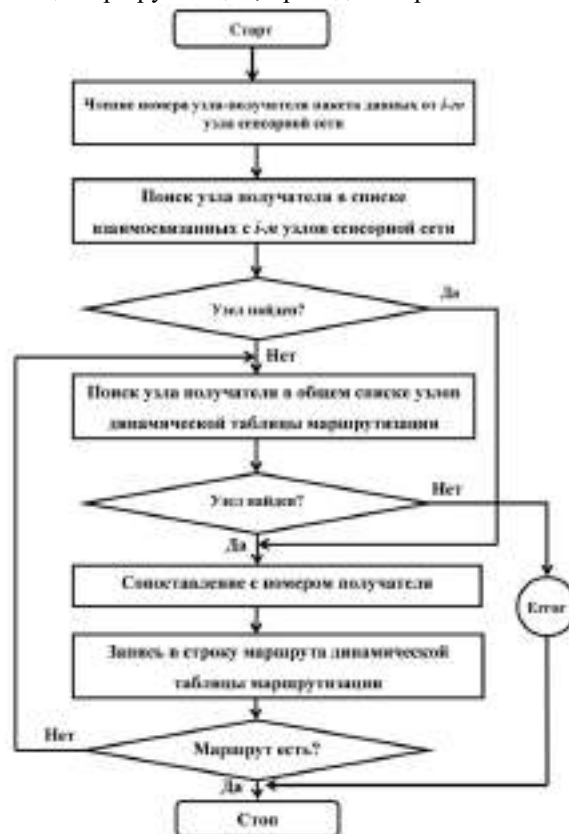
Рис. 3. Алгоритм построения трассы передачи данных от i -го узла произвольному узлу беспроводной сенсорной сети

Алгоритм построения трассы передачи данных от i -го произвольному узлу по динамической таблице маршрутизации, приведен на рис. 3.