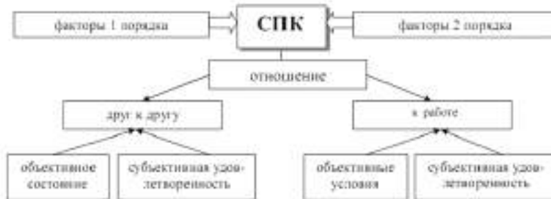
Рис. 3. Структура социально-психологического климата на площадке №8 «Новое поколение»

формирующих отношение к деятельности, – второго порядка.