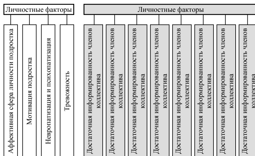
Рис. 1. Критерии благоприятного психологического климата в подростковом коллективе.

В качестве концептуальной основы критериями благоприятного психологического климата в подростковом коллективе были выделены следующие группы факторов (Рис. 1):