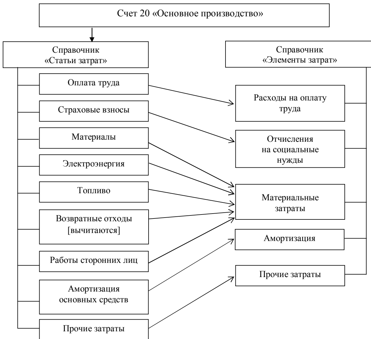
Рис. 3. Предлагаемый механизм взаимосвязи калькуляционных статей с экономическими элементами затрат в условиях автоматизации бухгалтерского учета

Данное решение представляется нам наиболее оптимальным и наименее трудоемким. Следовательно, вариант, предполагающий применение самостоятельных синтетических счетов (например, резервные 30-е счета в действующем Плане счетов) для учета затрат в разрезе экономических элементов для обеспечения взаимосвязи финансового учета с управленческим, утрачивает свою актуальность, тем самым сокращается количество корреспонденций в системе бухгалтерских счетов.