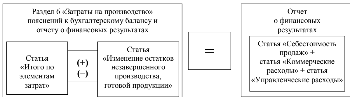
Рис. 1. Взаимоувязка показателей форм бухгалтерской отчетности при проверке соответствия затрат и расходов

В процессе аудита затрат необходимо сверить показатели отчета о финансовых результатах и раздела 6 «Затраты на производство» пояснений к бухгалтерскому балансу и отчету о финансовых результатах. При этом следует учитывать одно важное тождество, которое представлено на рисунке 1.