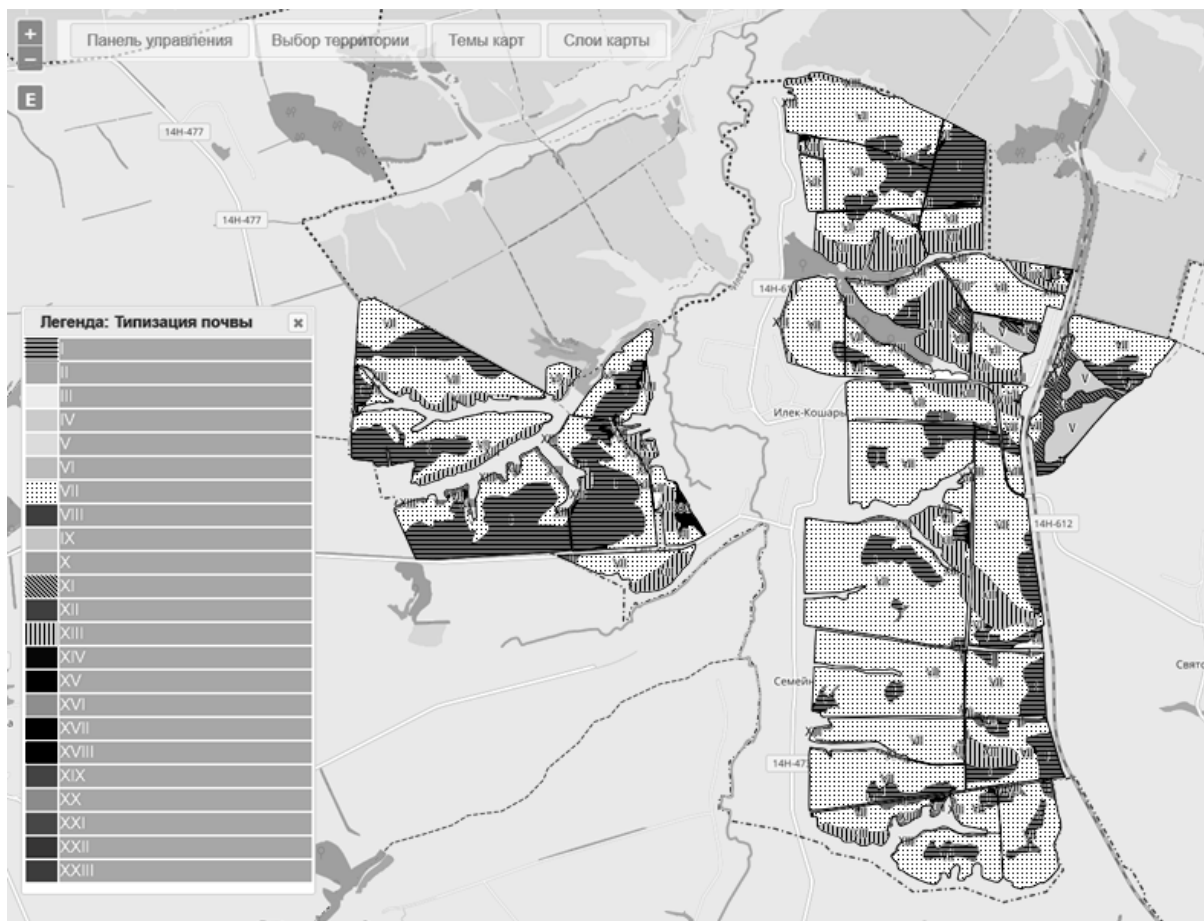
Рис. 2. Картограмма типизации земель хозяйства