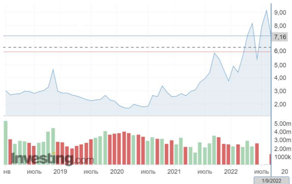
Рис. 3. Динамика стоимости фьючерсов на природный газ

Кроме того, по итогам закрытия торгов максимальная наблюдаемая стоимость достигала отметки в 2380 долл. США за тыс. куб. м. Кроме того, в 2022 году продолжали увеличиваться показатели добычи нефти, достигнув 8,2% в физическом выражении.