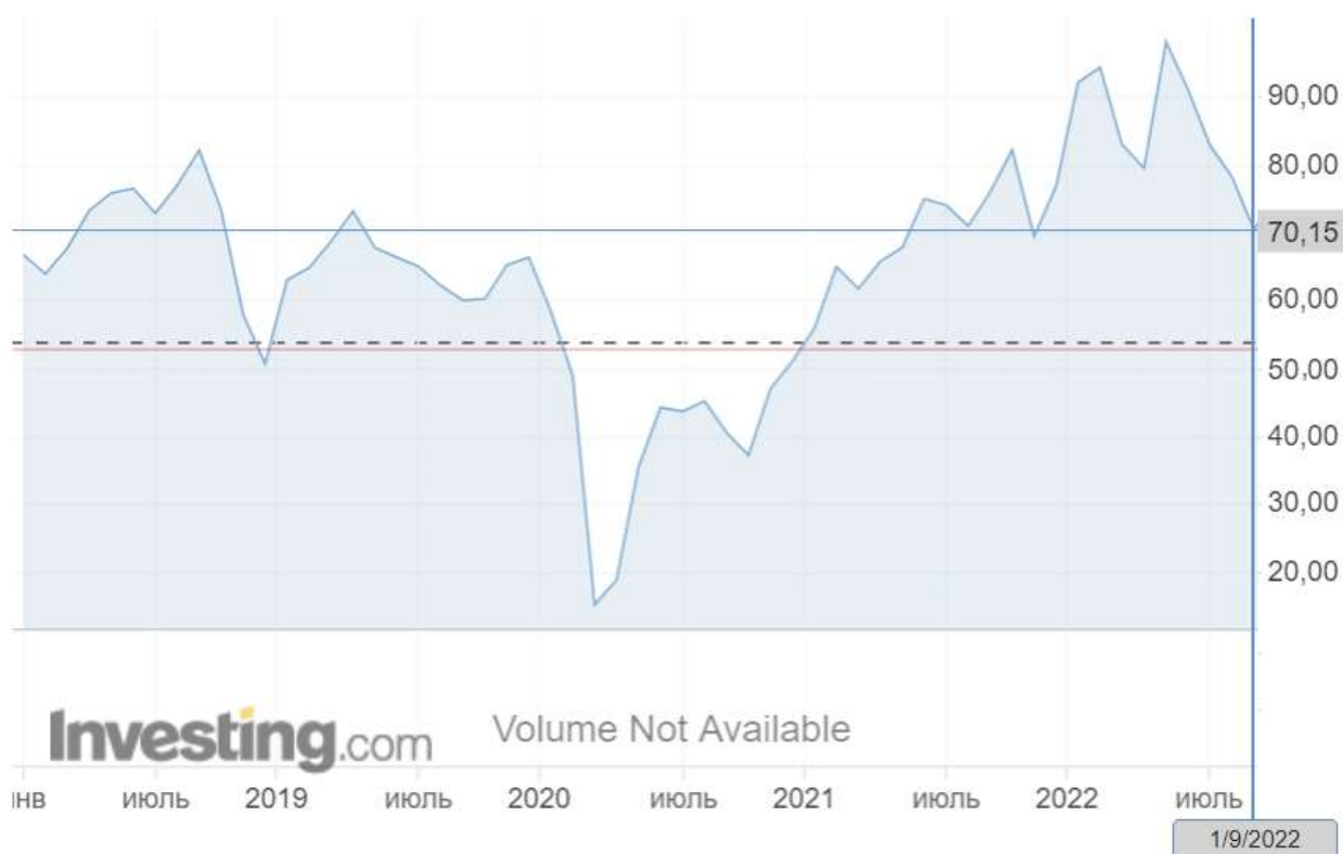
Рис. 2. Динамика стоимости нефти марки Urals

Рост доходов бюджета от деятельности нефтегазового сектора во многом строится на повышении стоимости нефти и газа на мировой арене. Так, динамика стоимости нефти марки Urals за последние 5 лет представлена на рис. 2: